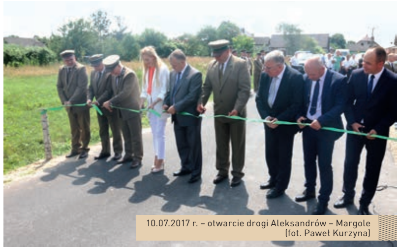
10.07.2017 r. – otwarcie drogi Aleksandrów – Margole

Wszystkie zadania drogowe zostały podzielone na trzy grupy. Najwyżej oceniane są wnioski dotyczące zadań zintegrowanych, czyli realizowanych w ciągach dróg, gdzie poszczególne jej odcinki są w różnych zarządkach: LP i samorządów lokalnych. Drogi wewnętrzne to te pozostające wyłącznie w zarządzie nadleśnictwa. Trzecią grupę stanowią drogi publiczne,