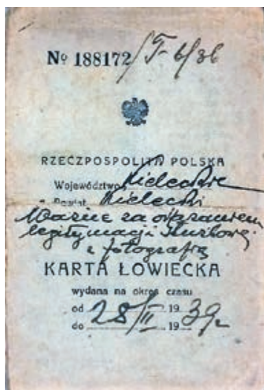
Karta łowiecka wydana w 1939 r.