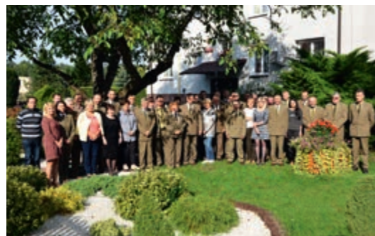
Załoga Nadleśnictwa Strzelce bardzo dobrze radziła sobie w minionym roku (s. 4), zdjęcie: archiwum Nadleśnictwa Strzelce